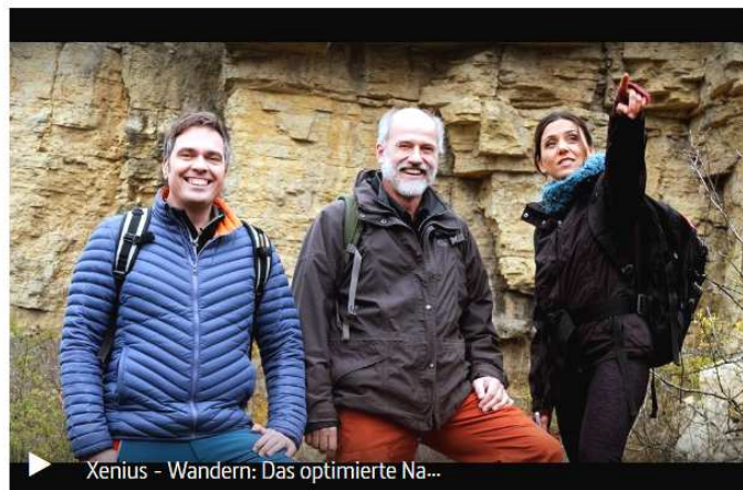
Xenius - Das Wissensmagazin auf ARTE (15.01.2018, 27 Min.)

Wandern ist die ursprünglichste Art für uns Menschen, längere Strecken zurückzulegen. Dabei ist es so viel mehr als einfach nur Gehen. Es geht um Natur, frische Luft, Erholung und manchmal sogar um Abenteuer. Doch für wen eignet sich Wandern? Wie schneidet es im Vergleich mit den Breitensportarten Joggen und Radfahren ab? Und was macht einen guten Wanderweg aus?