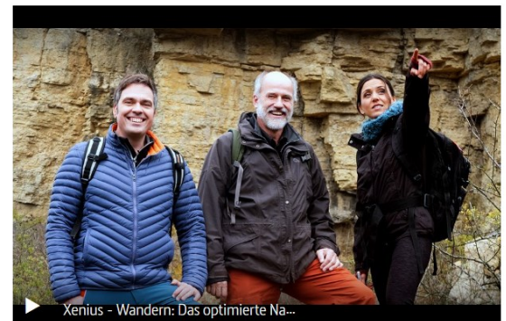
Xenius - Das Wissensmagazin auf ARTE (15.01.2018, 27 Min.)

Wandern ist die ursprünglichste Art für uns Menschen, längere Strecken zurückzulegen. Dabei ist es so viel mehr als einfach nur Gehen. Es geht um Natur, frische Luft, Erholung und manchmal sogar um Abenteuer. Doch für wen eignet sich Wandern? Wie schneidet es im Vergleich mit den Breitensportarten Joggen und Radfahren ab? Und was macht einen guten Wanderweg aus?